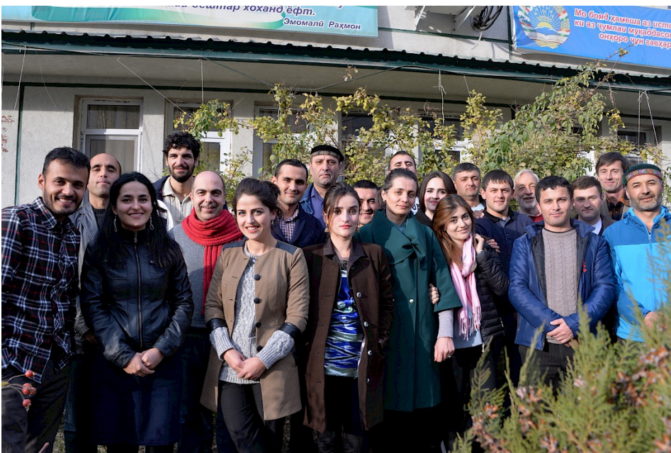
Intercultural Tour Guide Qualification „Basic“ für englischsprachige ReiseleiterInnen von PECTA (Pamir Eco-Cultural Tourism Association), Khorog, Tadschikistan, November 2017

Die Ergebnisse weiterer Forschungsdaten zum Thema „Erwartungen an die Reiseleitung in Entwicklungs- und Schwellenländern“ werden in einer Neuauflage der Studie „Tourismus in Entwicklungs- und Schwellenländer“ im