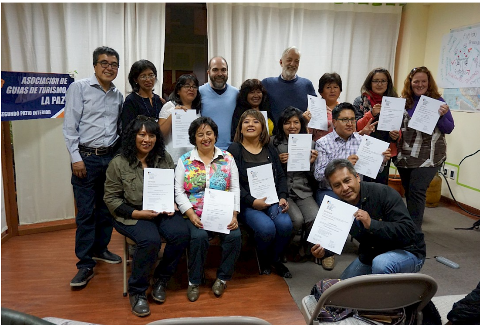
Intercultural Tour Guide Qualification „Sustainability“ für ReiseleiterInnen der bolivianischen Reiseleitervereinigung, La Paz, Bolivien, März 2019